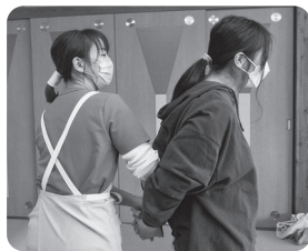
一人ひとりの身体に寄り添い施術をしてくださいました。やさしさがあふれる魔法の手でした。