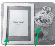
アクリルフレーム 透明お花シール

半透明が可愛い足型アートの作り方を紹介します。100円ショップで揃うアイテムで手軽に作れます。