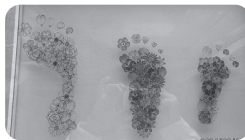
ママの作品 可愛い3人の子どもの足型の足型をとり、作ってみました。家の玄関に飾っています。